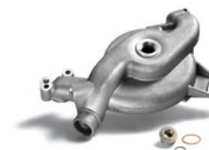
Dispositif de refroidissement