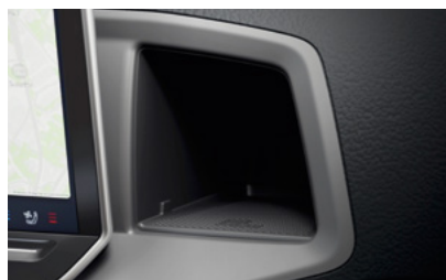
Tableau de bord digital

Tout est prévu pour vous : bénéficiez d'un confort de conduite grâce à l'intégration des smartphones avec Android Auto ou Apple CarPlay. L'écran MAN Média VAN affiche les applications sélectionnées, toutes accessibles via les commandes du volant multifonction. Profitez également de la charge sans fil ou des ports USB-C.